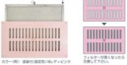
カラー(別): 標準色(既定色) | レディフィンク

○カートリッジ交換可能です。 交換用カートリッジ(フィルター付)別売もございます。 スライド式カートリッジ(フィルター付)取付可能