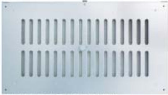
▲103FEX-A4020 サイズ(外寸): B450 H250 D18 アルマイトクリアー仕上げ(標準品)

【東京】〒160-0023 東京都新宿区西新宿6-12-1 パークウエストビル5F TEL(03)5325-6501 FAX(03)5325-6505 【大阪】〒556-0024 大阪市浪速区塩草3-9-4 TEL(06)6561-3901 FAX(06)6567-2414