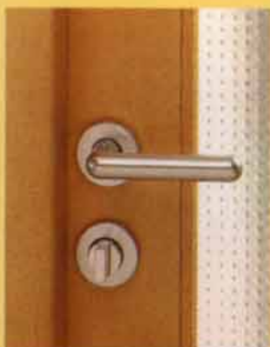
GOLF sur rosace argent