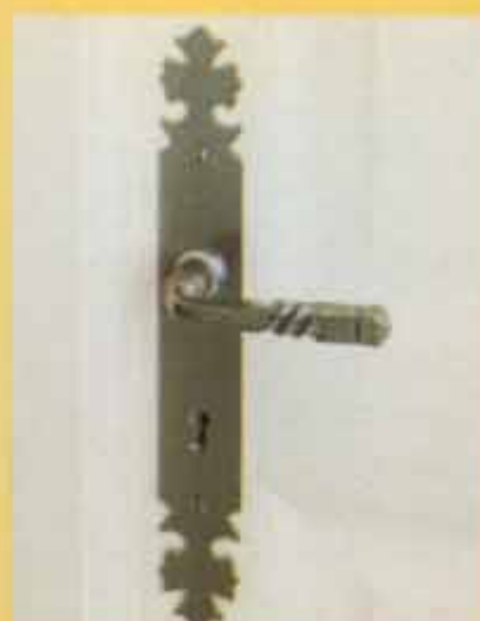
BOURGOGNE fer patiné