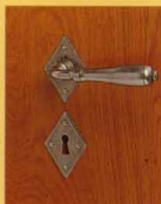
LAPRADE sur rosace fer patiné