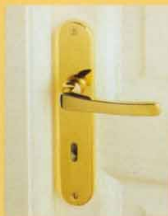
SIUSI laiton poli