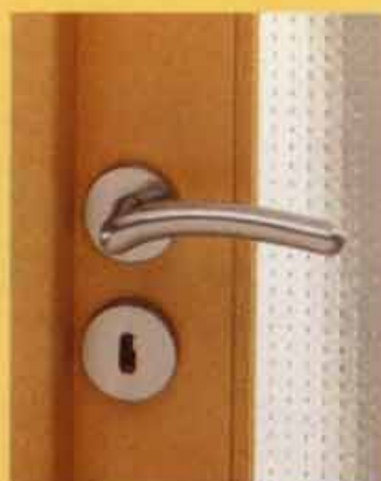
GREY sur rosace chrome mat