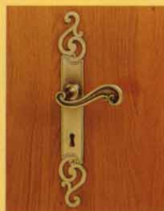
LOUIS XV vieux laiton