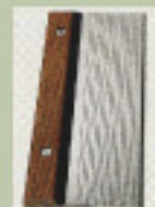
下枠(アルミ仕上げ)