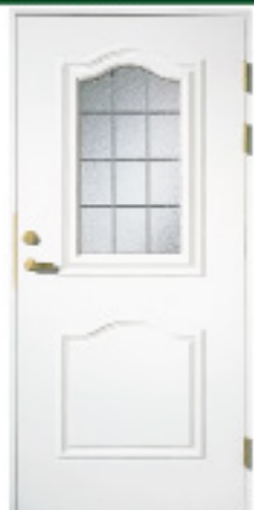
GA1015 (w) 約什塗装 材目録 仕様 標準ドア △ × 特注ドア GDM × ○ 防色塗装 × ○