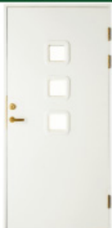
GA1047 (w) 特注対応品 ※写真とは別仕 材目録 仕様 標準ドア ○ × 防色塗装 ○ ○