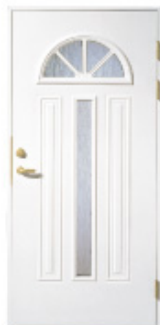
GA1013 (w) 約什塗装 材目録 仕様 標準ドア △ × 防色塗装 × ○ 防火設備(標準ドア) × ○