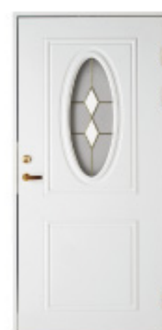
GA1048 (w) 特注対応品 ※写真とは別仕 材目録 仕様 チーク 在庫 オーク ○ 塗装(ホワイト) ○ 防色塗装 ○