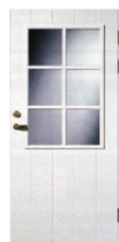
GA1048 (w) 特注対応品 ※写真とは別仕 材目録 仕様 標準ドア ○ × 防色塗装 ○ ○