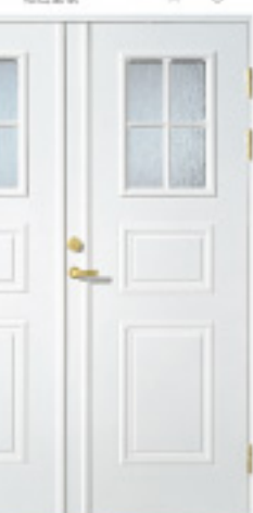
GA1017 (w) 親子 約什塗装 材目録 仕様 親子ドア (180) △ × 特注ドア GDM × ○ 防色塗装 × ○