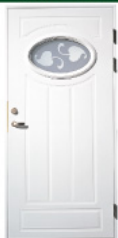
GA1012 (w) 約什塗装 材目録 仕様 標準ドア ○ × 特注ドア (236) × ○ 防色塗装 × ○