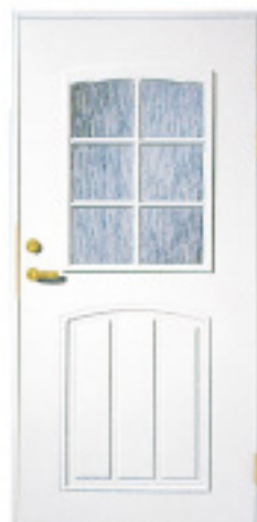
GA1030 (w) 約什塗装 材目録 仕様 標準ドア △ ×