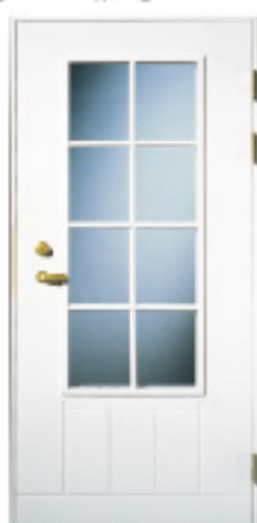
GA1050 (w) ★KIC+T 約什塗装 材目録 仕様 標準ドア △ × 親子ドア (180) × ○ 特注ドア (236) × ○ 防色塗装 × ○