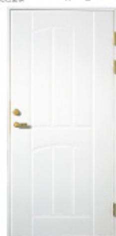
GA1010/1011 (w) 防火 約什塗装 材目録 仕様 標準ドア △ × 防色塗装 × ○ 防火設備(標準ドア) △ ×