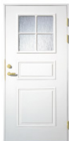
GA1026 (w) 防火 約什塗装 材目録 仕様 標準ドア ○ × ハイドア × ○ 親子ドア (180) △ × 特注ドア (236) × ○ 防色塗装 × ○ 防火設備 × ○ 防火設備(標準ドア) ○ × 防火設備(ハイドア) × ○