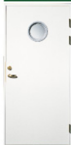
GA1046 (w) 特注対応品 ※写真とは別仕 材目録 仕様 標準ドア ○ × 特注ドア (236) × ○ 防色塗装 ○ ○