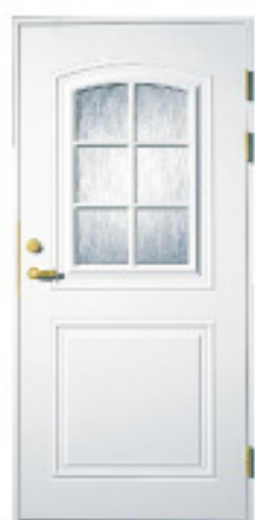
GA1016 (w) 防火 約什塗装 材目録 仕様 標準ドア ○ × ハイドア △ × 特注ドア GDM × ○ 防色塗装 × ○ 防火設備(標準ドア) ○ × 防火設備(ハイドア) △ ×