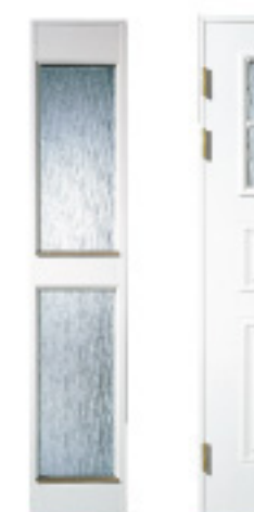
GA135D (w) 防火 約什塗装 材目録 仕様 標準ドア ○ × ハイドア △ × 防色(標準) ○ × 防火設備(ハイドア) × ○