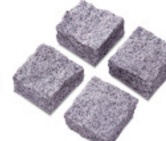
ピンコロIM603、六面割肌 ¥95/個

4020 200~400×200~400×20~30mm, O. 25G/パック