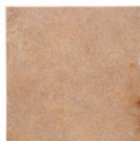
砂岩IM903、規格品、割肌 ¥6,750/m 2

4004 200~400×200~400×15~25mm, O. 25G/パック