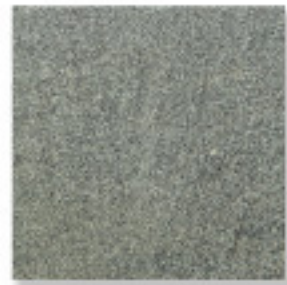
スレートIM951、規格品、割肌 ¥6,500/m 2

4010 200~400×200~400×10~20mm, O. 25G/パック