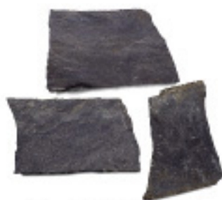
スレートIM906、乱形、割肌 ¥5,750/m 2

4005 300×300×10~20mm, 8枚/パック 4006 400×400×15~20mm, 5枚/パック