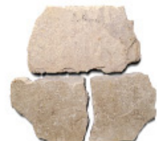
砂岩IM918、乱形、割肌 ¥6,250/m 2

4017 300×300×10~20mm, 8枚/パック 4018 400×400×15~25mm, 5枚/パック