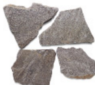
石英岩IM971、乱形、割肌 ¥6,000/m 2

4011 300×300×10~15mm, 8枚/パック 4012 400×400×15~20mm, 5枚/パック