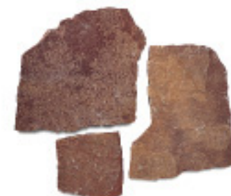
砂岩IM928、乱形、割肌 ¥6,000/m 2

4014 300×300×10~15mm, 8枚/パック 4015 400×400×15~25mm, 5枚/パック