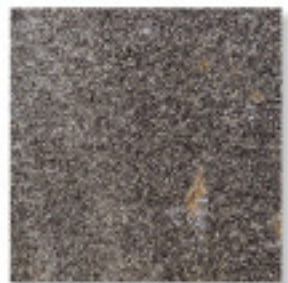
石英岩IM971、規格品、割肌 ¥6,750/m 2

4013 200~400×200~400×20~30mm, O. 25G/パック