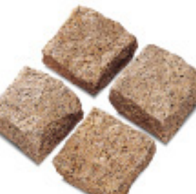
ピンコロIM691、六面割肌 ¥100/個