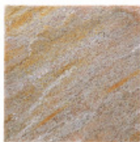
石英岩IM901、規格品、割肌 ¥6,750/m 2

4001 200~400×200~400×15~25mm, O. 25G/パック