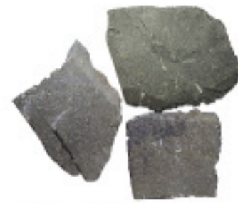
スレートIM951、乱形、割肌 ¥5,750/m 2

4008 300×300×10~15mm, 8枚/パック 4009 400×400×15~20mm, 5枚/パック