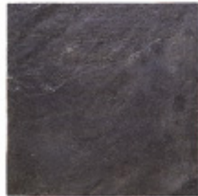
スレートIM906、規格品、割肌 ¥6,500/m 2

4007 200~400×200~400×15~25mm, O. 25G/パック