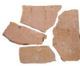
砂岩IM903、乱形、割肌 ¥6,000/m 2

4002 300×300×10~20mm, 8枚/パック 4003 400×400×15~20mm, 5枚/パック