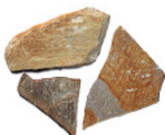
石英岩IM901、乱形、割肌 ¥6,000/m 2

4001 200~400×200~400×15~25mm, O. 25G/パック