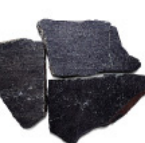
石英岩IM974、乱形、割肌 ¥6,250/m 2

4019 200~400×200~400×20~30mm, O. 25G/パック