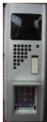
外部テンキー カメラ付設置例