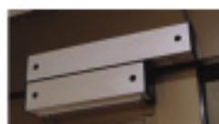
マグネット電気錠 ※防水仕様もございます。