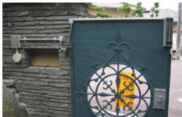
門扉右上が施錠マグネット