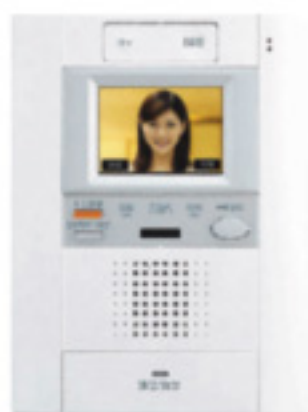
室内テレビドアフォン